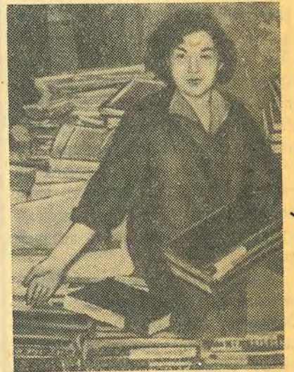
«Диссертационный завал» в углу читального зала.